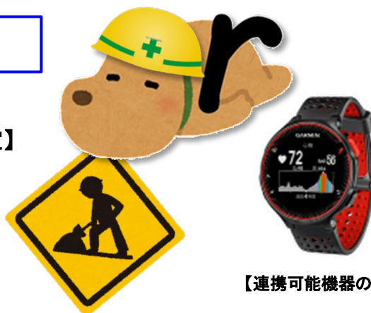
【連携可能機器の例】