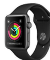
【連携可能機器の例】

本事業は、ご自身が所有される「Apple WATCH (アップルウォッチ)」で測定された歩数との連携が可能です。