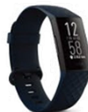
【連携可能機器の例】

本事業は、ご自身が所有される「fitbit (フィットビット)」で測定された歩数との連携が可能です。