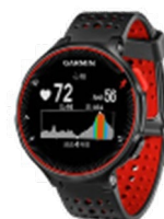
【連携可能機器の例】

本事業は、ご自身が所有される「GARMIN (ガーミン)」で測定された歩数との連携が可能です。