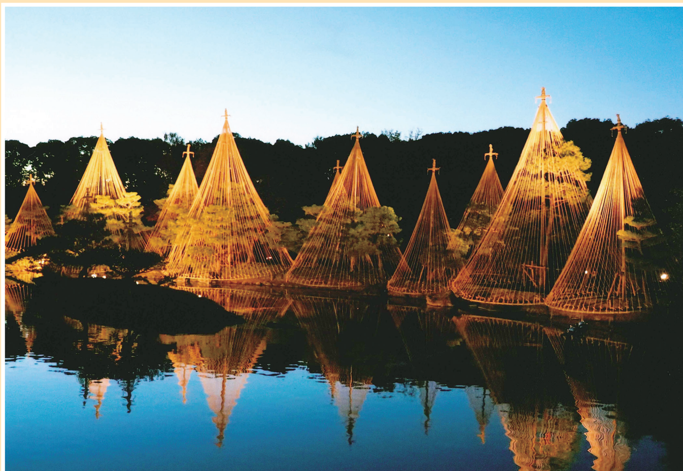
「黄昏の雪吊り」 愛知県名古屋市