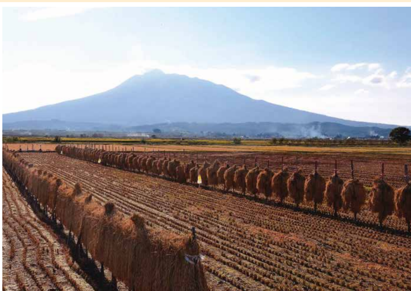
「津軽平野秋景」 青森県弘前市