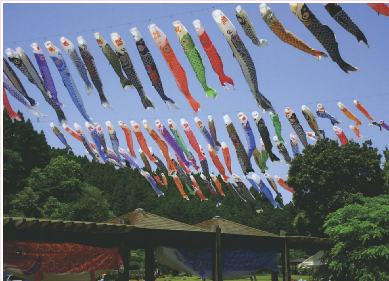
「こいのぼり」千葉県茂原市ひめはるの里 大塚喜男（千葉県）