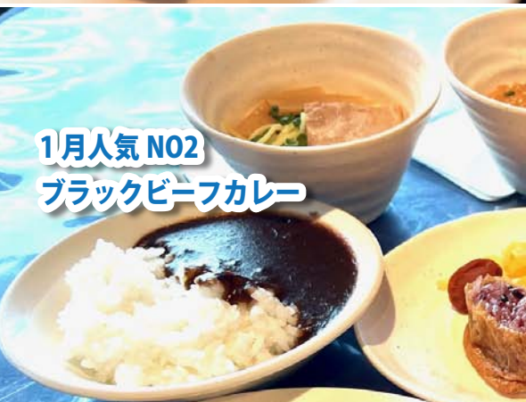
1月人気 N02 ブラックビーフカレー