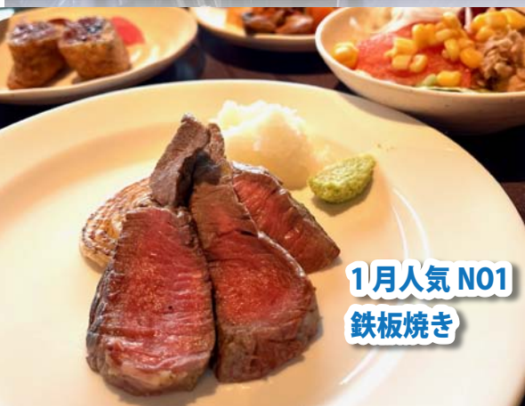
1月人気 N01 鉄板焼き