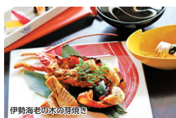
伊勢海老の木の芽焼き

食事 ●夕食はレストランで伊勢海老の木の芽焼きをメインに春の食材が並びます ●朝食はレストランで和食膳 ★夕食をスタンダード「鴨川会席」に変更は大人1名様2,000円引 ★朝食は1名様プラス1,500円で庭園を望むテラス席でのプレミアム朝食(ミニ京会席風)へ変更可 条件 4/1～5/31／客室定員利用時の料金