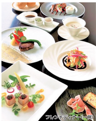
フレンチディナー(一例)

【条件】 4/1〜6/30 / 土・休前日と4/1〜8利用は1名様プラス2,000円 / 4/29〜5/6利用は1名様プラス2,500円 / 海側和室・洋室ツイン利用は要問合せ / 3日前までに要予約