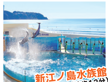
新江ノ島水族館(徒歩12分)

特典 ●通常大人2,500円、小学生1,200円、幼児(3歳以上)800円の新江ノ島水族館チケット付 ●駐車場無料&荷物預かり可