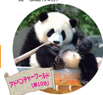
アドベンチャーワールド (車10分)

GW限定 伊勢海老と牛陶板焼き 豪華会席プラン 1泊2食 1室2名～ 21,000円～23,000円 ★小学生まで全日8,500円 ※2日前までに要予約