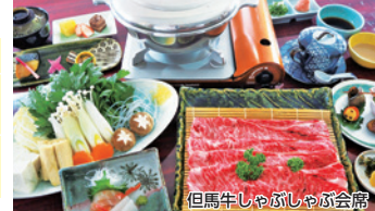
但馬牛しゃぶしゃぶ会席