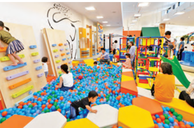
ボーネルンドプレイヴィル 大阪城公園

お子様(小学生まで)添い寝 無料 条件 4/1～6/30／土・休前日と4/29、5/2利用は1名様プラス1,500円／シングル利用はプラス1,000円／トリプル利用は1名様1,000円引／1名様プラス500円で大阪城側客室