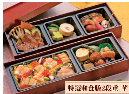
特選和食膳2段重 華