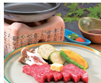
あしたか牛ステーキ

食事 あしたか牛が付いた豪華会席 ★あしたか牛を「ステーキ」「しゃぶしゃぶ」「すき焼き」から1組でお1つ選べます（要予約）