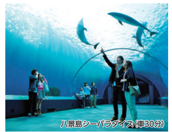
八景島シーパラダイス(車90分)

【条件】 4/6〜6/30 (4/29〜5/6除く) / シングル利用は1名様プラス1,000円 / 大正館指定は1名様プラス1,000円 / Tなし客室は1名様1,000円引 / 客室タイプにより料金変更の場合あり