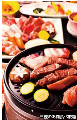
三種のお肉食べ放題

条件 7/1~9/30(7/18・19・8/9~15・9/19~22除く) / 1室1名様利用はプラス1,000円(平日のみ利用可) ★除外日は「伊勢海老と熊野牛の特別プラン」20,900円~ ★当館は明光バス「白良浜」バス停から徒歩2分