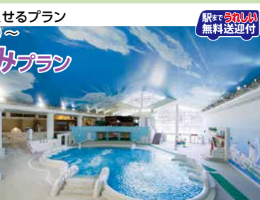
箱根小涌園ユニネッサン

※7/18・19利用は大人19,500円(3名様～) ※8/8～15、9/19～22利用は大人21,500円(3名様～) ※8/1～7、16～23利用は大人プラス1,000円 ※8/24～31利用は大人16,500円 条件 7/10～9/30 / 半露天風呂付客室利用は1名様プラス6,000円(大人2名様～) 特典 箱根小涌園ユニネッサン(水着ゾーン)・森の湯の全エリア対象のパスポート付(大人3,500円～4,000円相当)