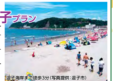
逗子海岸まで徒歩3分

条件 7/1～8/31/シングル利用、大正館指定は1名様プラス1,000円～/Tなし客室利用は1名様500円引～/3日前までに要予約