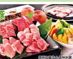
信州山麓牛&信州米豚

※8/1～23利用はお1人様17,450円 ★7/1～17利用はお1人様13,850円 食事 信州山麓牛&信州米豚が自家製あま目ダレで食べ放題(90分)