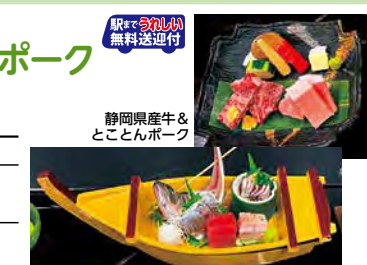
静岡産牛&とことんポーク

食事 ●静岡産牛&とことんポークの陶板焼き ●鰯の姿造り など 条件 7/1～9/30 / 1室1名様利用はプラス1,000円(平日のみ利用可)