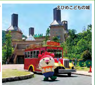
えひめこどもの城

条件 7/1~9/30(7/18・19・8/7~15・9/19~22除く) / 客室タイプにより料金変更