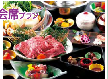
但馬牛しゃぶしゃぶ会席

条件 9月中旬~9/30(詳細は要問合せ) / 1室1名様利用はプラス1,000円(平日のみ利用可)