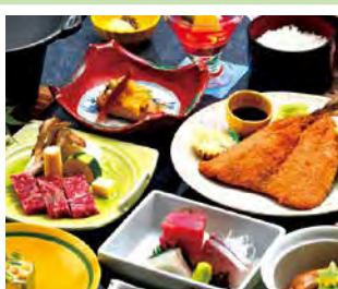
あしたか牛とアジフライ

おすすめ観光 富士山も望める島郷・志下海水浴場(徒歩1分) / ライフセーバー配置期間: 令和8年8/1～16 ★敷地内から海に出られます(温水シャワーあり) ★パラソル・チェア無料貸出 金目鯛の煮付けプラン 1泊2食 1室2名～ 11,850円～19,850円