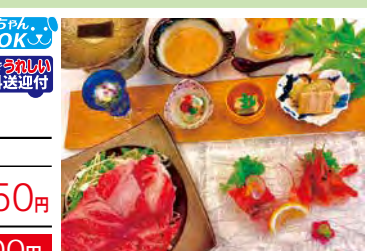
にいがた和牛と南蛮エビ

食事 ●にいがた和牛しゃぶしゃぶ ●南蛮エビのお刺身 ほか 条件 7/1～9/30 / 檜風呂付客室利用は1名様プラス2,000円 / ワンちゃん同室利用は1名様プラス1,500円