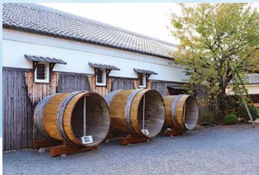
伏見/月桂冠大倉記念館