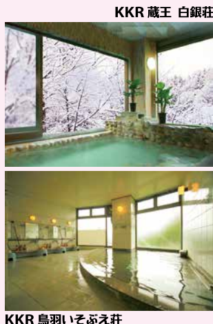
KKR 蔵王 白銀荘