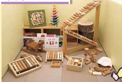
こだわりのキッズルーム