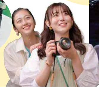
テラスから見上げる星空