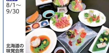
北海道の味覚会席

食事 北海道の味覚料理をお部屋食で ★お子連れのお客様にはプラス1,000円で特製「鍋プリ」をプレゼント