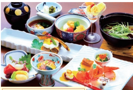
月替わりの創作料理 木賀会席

山の幸なら「足柄牛会席」です。飼料に足柄茶を加え、丹沢水系の湧き水で育てられた神奈川のブランド牛の様々な部位を様々な調理法でおなか一杯召し上がっていただけます。また、「箱根会席」はおひとり様でもご利用いただけるおすすめ料理です。ご自身で焼いて味わう「足柄牛の陶板焼き」のほか、伊勢海老一尾を半身はお造り、半身は塩焼き、残った兜は翌朝の味噌汁と三つの調理法で提供しており、海の幸・山の幸を両方楽しめます。