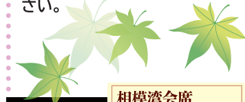
相模湾会席 伊勢海老のお造り

将軍家にも献上された「木賀温泉」の源泉を所有しております。庭園の樹木に囲まれたかけ流しの露天風呂と、私共の料理でゆるりと箱根の四季をお楽しみください。