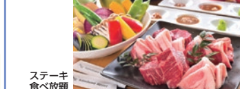
ステーキ食べ放題

条件 8/1～9/30(8/15除く) / 1室1名様利用はプラス500円 / Tなし客室利用は1名様1,000円引