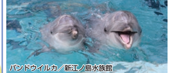
バンドウイルカ / 新江ノ島水族館

食事 新鮮な魚介類を使った和風会席をお部屋で 条件 8/1～9/30 / 1室1名様利用、BT付客室利用はプラス1,000円