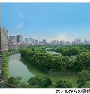
ホテルからの景観