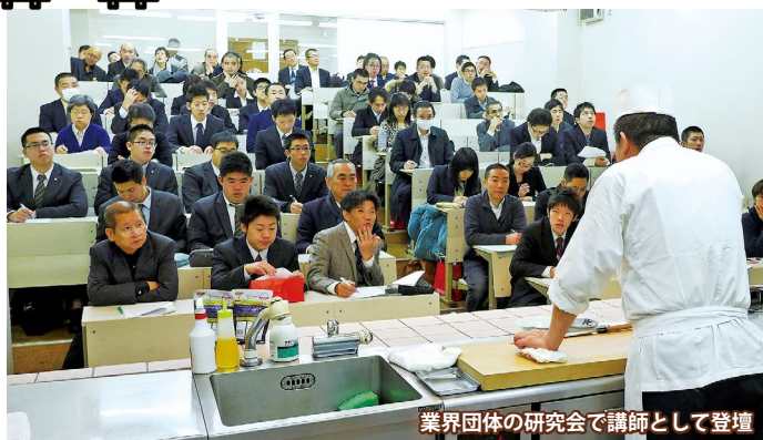
業界団体の研究会で講師として登壇