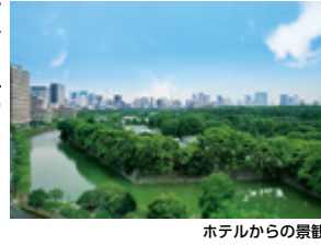
ホテルからの景観

条件 9/12~11/30(土・休前日を除く)/1室2名様の場合1名様プラス1,500円で皇居側デラックスツインへ変更可