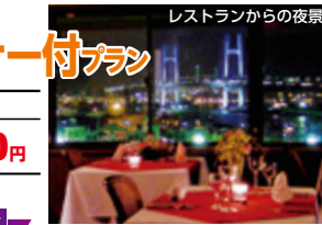
レストランからの夜景

6060朝食付プラン 9/19~11/30 1泊朝食付 お1人様 6,060円 ※月・火・水(平日)限定(休前日除く) ※お部屋タイプお任せ/1日2室限定