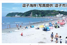
逗子海岸

※7/22～8/15、8/21・28利用はお1人様16,580円（プレミアム会席） 食事 あわび or 葉山牛サーロイン陶板焼きから選べます 条件 7/1～9/5 / シングル利用、大正館指定は1名様プラス1,100円 / Tなし客室利用は1名様1,100円引 / 3日前までに要予約