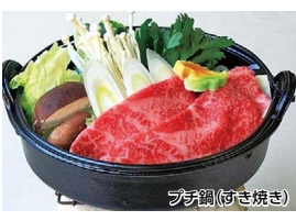
プちなべ（すき焼き）

※7/21～24、8/7～15、9/18・19利用は別料金のため要問合せ 食事 蔵王牛小鍋、前菜、刺身などの会席膳（全11品） ★「しゃぶしゃぶ」or「すき焼き」から選択可 ★小学生までのお子様はキッズステーキディナー（お1人様7,440円） 条件 7/1～9/30 / 1室1名様利用はプラス1,000円 / Tなし客室利用は1名様1,000円引 特典 小学生まで花火セットプレゼント（7/17～8/31）