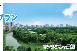
ホテルからの景観

特典 ●12歳以下のお子様添寝無料 ●駐車場無料（宿泊日6:00～翌22:00） 条件 7/1～8/31（土・休前日を除く） / 1室1名様利用はプラス600円 / お部屋タイプはホテルおまかせ