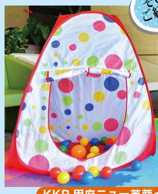
KKR 甲府ニュー芙蓉の テントハウス