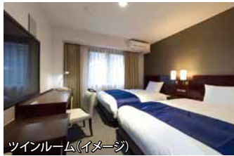
ツインルーム(イメージ)