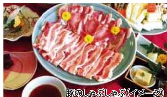
豚のしゃぶしゃぶ(イメージ)