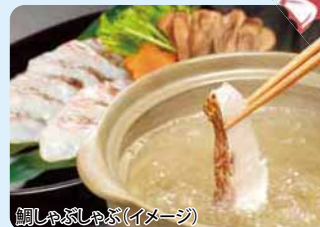
鯛しゃぶしゃぶ(イメージ)