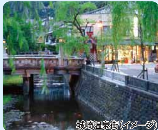
城崎温泉街(イメージ)