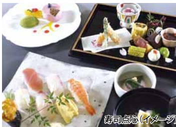
寿司点心(イメージ)

特典 ●名古屋城入場券プレゼント(大人500円相当) ●13時からチェックインOK(通常15時) ●ワンドリンク無料券進呈(夕食時利用可) ●1室2名様以上で名古屋城側のお部屋をご用意 ●1室3名様利用は1部屋あたり1,000円引 ●小学生までの料金対象のお子様は1,000円引