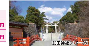
武田神社(イメージ)

条件 4/1~6/30(4/29~5/7除く) / 1室1名様利用はプラス1,000円(平日のみ利用可) / トイレ付客室利用は1名様プラス1,000円