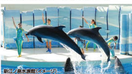
新江ノ島水族館(イメージ)

●お子さま花火プレゼント(7/1〜8/31)●ファミリーカラオケ 2時間 5,000円(要予約)●車、荷物等明から預かり可●食前酒サービス