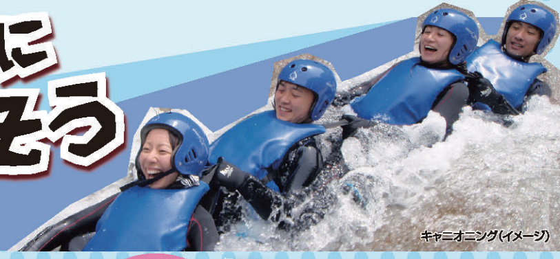
キャニオニング(イメージ)