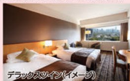
デラックスツイン(イメージ)