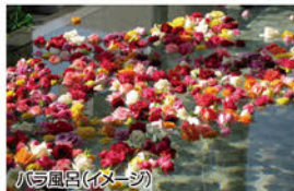
バラ風呂(イメージ)