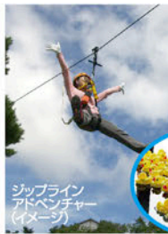
ジップライン アドベンチャー (イメージ)