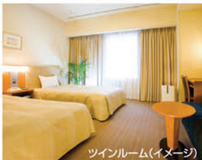
ツインルーム(イメージ)

条件 7/1~9/30(8月の土曜日、8/14・15、9/19~22除く)/1日限定5室 ※8月は平日も土・休前日料金となります