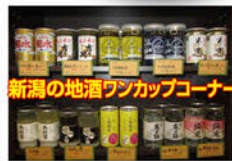
新潟の地酒フナカップコーナー