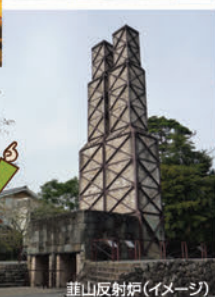
韮山反射炉(イメージ)