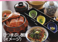
ひつまぶし御膳(イメージ)