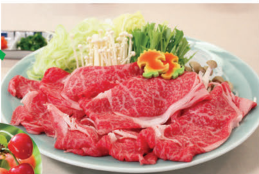
蔵王牛しゃぶしゃぶ(イメージ)