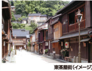
東茶屋街(イメージ)

ホテルを拠点に古都金沢を気ままに散策。目の前の金沢城址公園を抜けること兼六園。ひがし茶屋街へも歩いて行けます