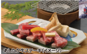
あしたか牛ステーキ(イメージ)

●海水浴ならここ15分サンビーチ・車30分●雨でも泳ぎたい!屋内温水プール(町営)●車10分●イルカショーや水族館なら三津シーパラダイス・あひまリゾートパーク●車20分●いろんな自転車を楽しめる!サイクルスポーツセンター●車30分