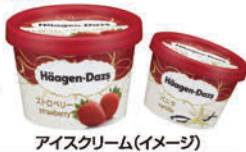
アイスクリーム(イメージ)