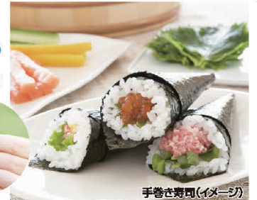
手巻き寿司(イメージ)