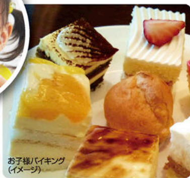
お子様バイキング (イメージ)