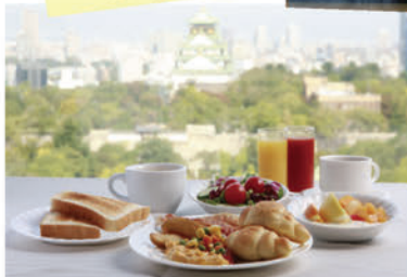
モーニング(イメージ)