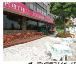
ガーデンテラス(イメージ)