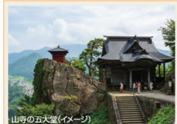
山寺の五大堂(イメージ)

会席風和食は1名様プラス2,200円でお肉料理を蔵王牛すき焼orしゃぶしゃぶに変更可(要予約2日前/2人前から/1グループ同一メニュー)