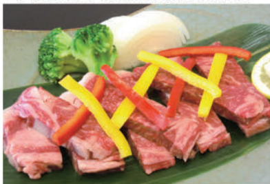
あしたか牛ステーキ(イメージ)