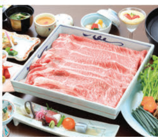
足柄牛すき焼き(イメージ)