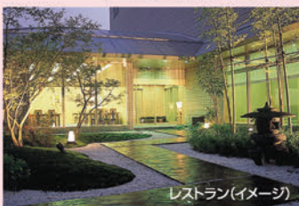
レストラン(イメージ)