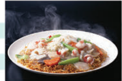
あんかけ焼きそば(イメージ)