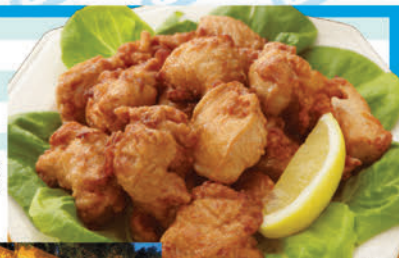
キッズバイキング(イメージ)