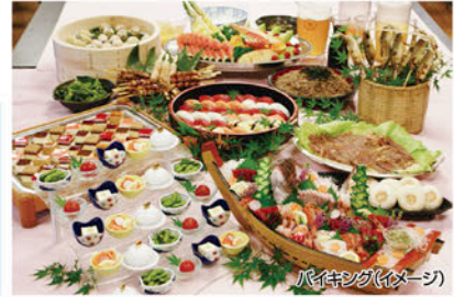
バイキング(イメージ)

長野県 上諏訪温泉 KKR 諏訪湖荘 長野県諏訪市湖岸通り 5-7-7 客室一部BT付 ☎ 0266-58-1259 チェックイン 15:00 チェックアウト 10:00