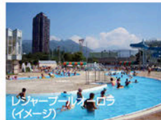
レジャープールオーロラ (イメージ)