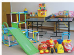
キッズルーム(イメージ)