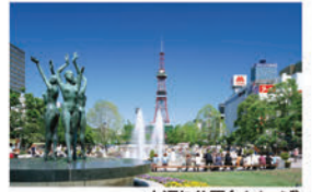
大通り公園(イメージ)

●さっぽろ夏まつり(7/22~8/20) ●北海道マラソン(8/30) ●さっぽろオータムフェスト(9/11~10/4)