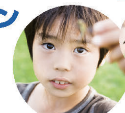
チビッコ忍者村(イメージ)