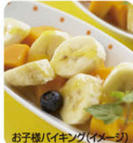
お子様バイキング(イメージ)

わんちゃんも一緒にお部屋で過ごせます ※料金・プラン等は裏面の 広告をご覧ください