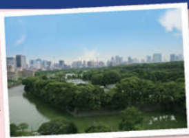
ホテルからの景観(イメージ)