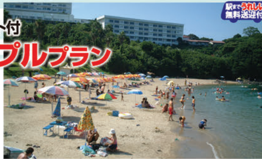
提携ホテルプライベートビーチ(イメージ)