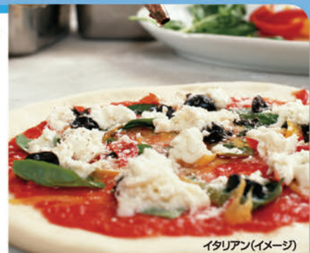
イタリアン(イメージ)