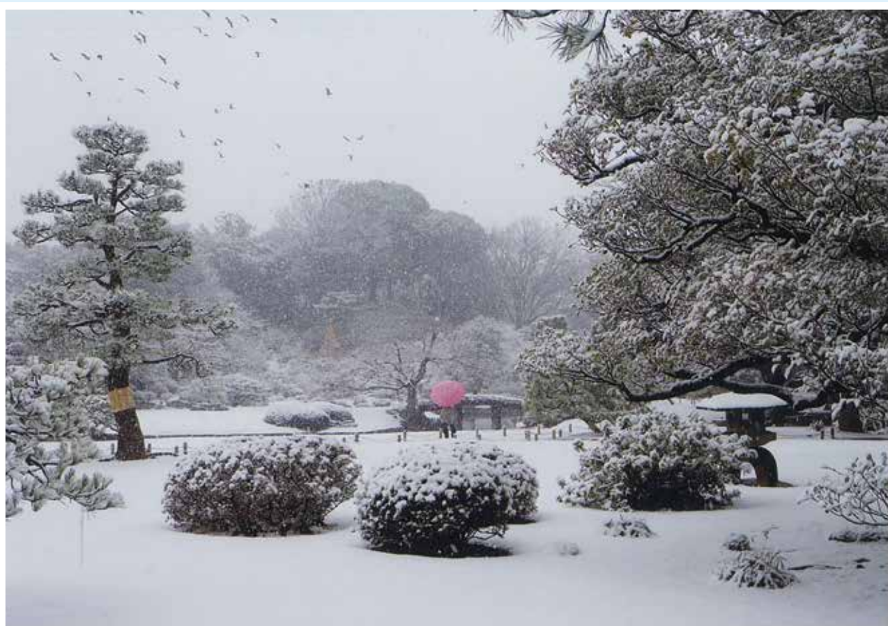
「雪景色」東京都文京区六義園