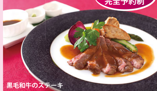
黒毛和牛のステーキ