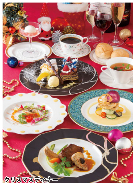
クリスマスディナー