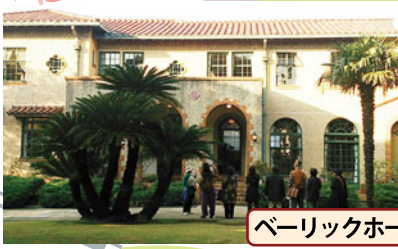
ベーリックホール