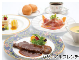
カジュアルフレンチ