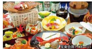
宝楽会席(イメージ)

紅葉情報 石山寺・日吉大社・西教寺・三井寺 紅葉ライトアップ(11月中旬~下旬予定)