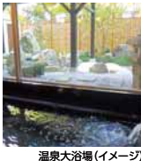
温泉大浴場(イメージ)