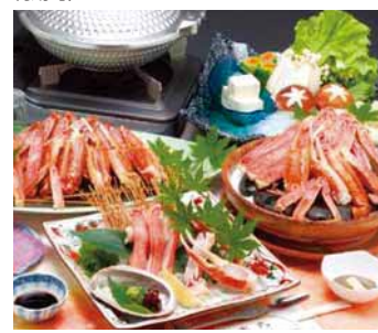
かにづくし(イメージ)

1泊2食 1室2名~ 平日 13,900円 土・休前日 14,900円 ★10月中にご宿泊の方は1,000円引 ※詳しくは施設にお問い合わせください