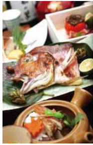
秋野菜と甘鯛会席(イメージ)