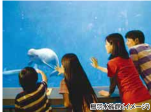
鳥羽水族館(イメージ)

※T付8畳利用は1名様プラス1,000円 ※BT付10畳利用は1名様プラス2,000円(いずれも小・中学生は追加料金不要) ★大人5,700円、中学生3,750円、小学生2,950円相当の鳥羽まるみえバスポート(鳥羽水族館・ミキモト真珠島・鳥羽湾めぐり&イルカ島 入場券)付