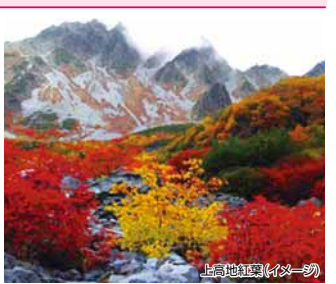
上高地紅葉(イメージ)

食事 A5飛騨牛しゃぶしゃぶが1品ついた 秋のグルメ地元和会席料理 ★1名様プラス1,000円で特別和室 にてお部屋に変更可