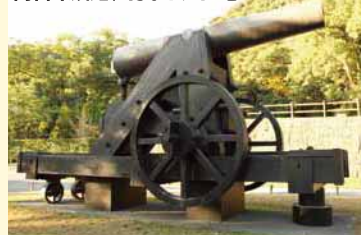
尚古集成館 / 150ポンド砲 (イメージ)