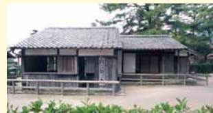
松下村塾 (イメージ)