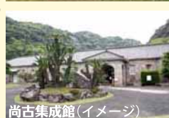
尚古集成館 (イメージ)