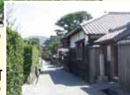
萩城下町 (イメージ)